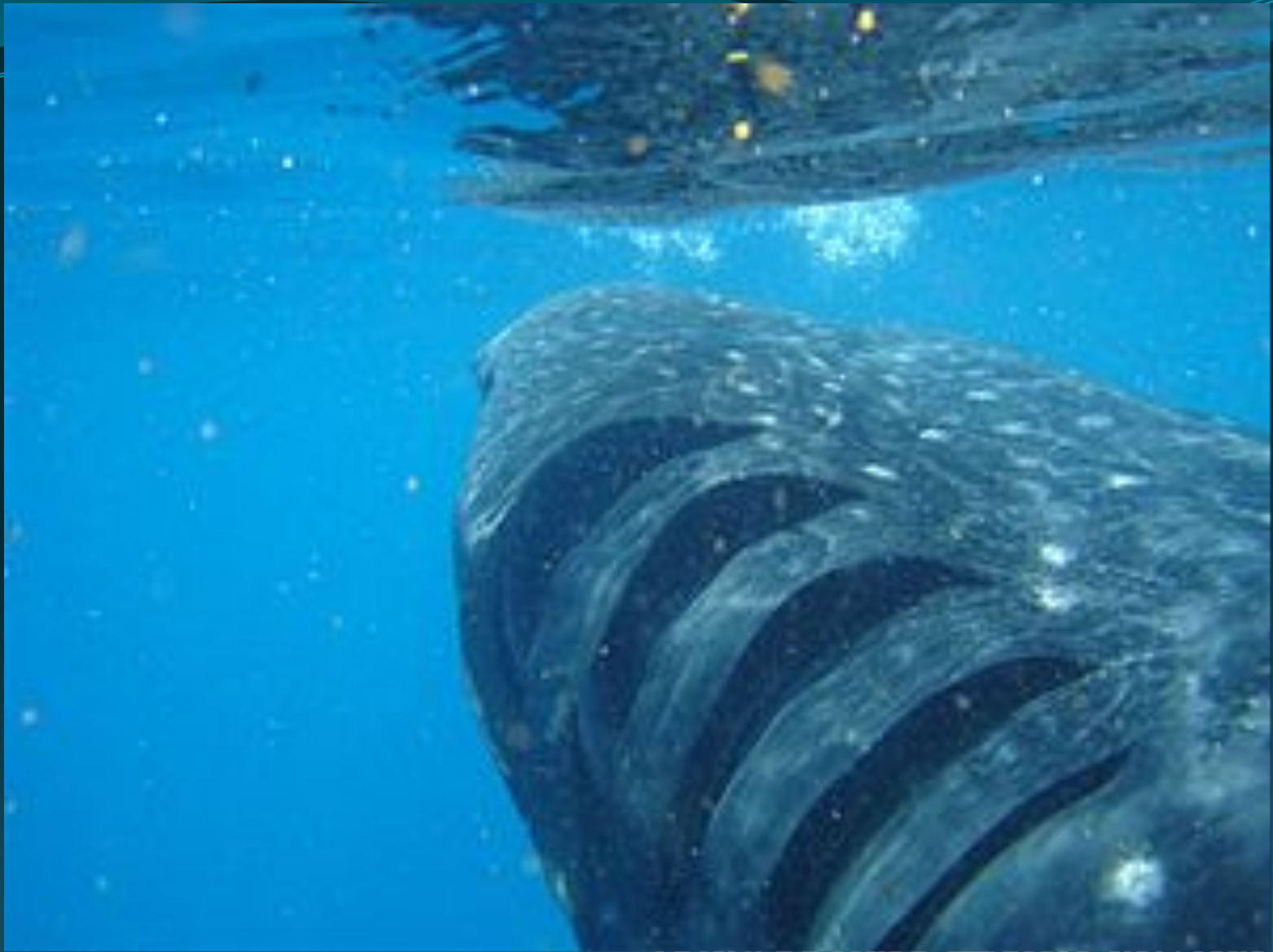
Жаберные щели акулы