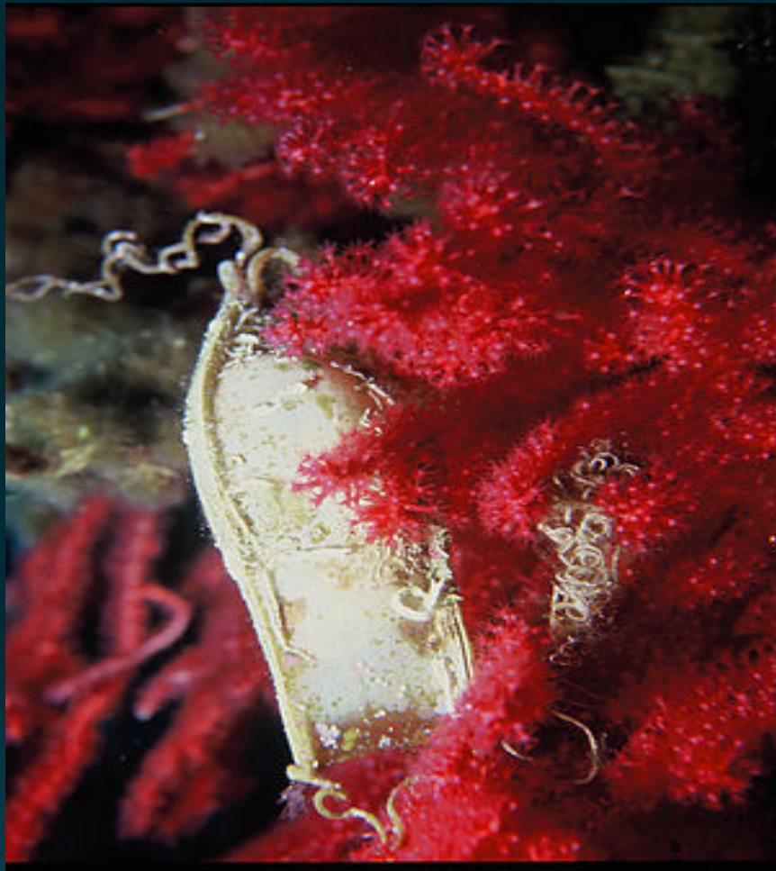
Яйцевая капсула акулы